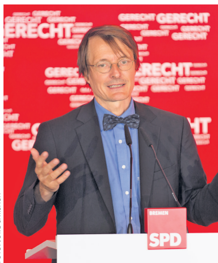
Der SPD-Gesundheitsexperte Karl Lauterbach in Bremen.

und ein radikales Zurückfahren des bürokratischen Apparates, so Karl Lauterbach. Gesundheitspolitik zeige wo der Unterschied zwischen SPD und CDU liege. Der SPD-Gesundheitsexperte machte deutlich, dass der SPD-Vorschlag einer Bürgerversicherung das solidarische Gegenmodell zu den elitären Gesundheitsvorstellungen der aktuellen Bundesregierung sei. Karl Lauterbach beschrieb die Ängste der Bürgerinnen und Bürger, beim derzeitigen Gesundheitssystem auf der Strecke zu bleiben. Dieser Angst und der von CDU präferierten Kopfpauschale im Gesundheitssystem wolle die SPD mit der Bürgerversicherung begegnen. Karl Lauterbach machte deutlich, dass man weder eine Einheitsbehandlung, noch einen Einheitspatienten wolle. Stattdessen wolle man zurück zu einem System, in dem die, denen es am schlechtesten gehe, am meisten bekommen. Selbstverständlich sei dies auch eine ideologische Überlegung – ideologisch in dem Sinne, als dass die Qualität der Behandlung nicht von der Dicke des Geldbeutels abhängen darf und dass eine gute ärztliche Versorgung nicht nur in einkommensstarken Regionen gegeben sein darf – eine Zwei-Klassen-Medizin sei mit der SPD nicht zu machen. Klaus Wiese- hülgel und Karl Lauterbach stellten fest, dass es Deutschland nicht wegen dieser Regierung einigermaßen gut gehe – sondern trotz dieser Regierung! Beide zeigten, die SPD ist personell gut aufgestellt für einen Regierungswechsel nach der Bundestagswahl. ■