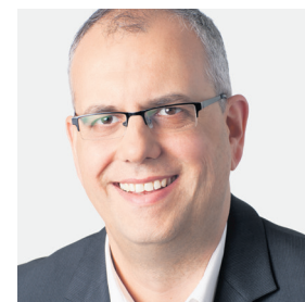
Dr. Andreas Bovenschulte (48) ist seit Juni 2010 Landesvorsitzender der Bremer SPD.

Insbesondere Gewerkschaften und Betriebsräte fordern eine vollständige Rekommunalisierung der Abfallentsorgung. Zur Begründung verweisen sie unter anderem auf eine deutliche Verschlechterung der Arbeitsbedingungen der Beschäftigten im Zuge der Privatisierung. Unterstützt werden sie von kritischen Wissenschaftlern, die der Auffassung sind, dass die Privatisierung der Entsorgung für Bremen insgesamt ein schlechtes Geschäft war. Es gibt allerdings auch Stimmen in Politik und Verwaltung, die die Ergebnisse der Privatisierung positiver bewerten.